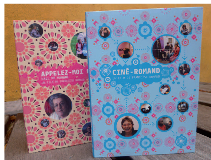
Les films de Françoise Romand sont édités en DVD et peuvent être empruntés à la médiathèque de Bagnolet.

Son arrière-grand-père joue dans L'Arroseur arrosé , le premier film de fiction des frères Lumière, et vécut jusqu'à 100 ans. Françoise Romand a repris ce tuyau du cinéma qui s'invente au fur et à mesure, avec les outils vidéo d'aujourd'hui : « C'est petit, c'est intimiste, on peut écrire avec comme avec un stylo. » Après l'IDHEC, en 1977,