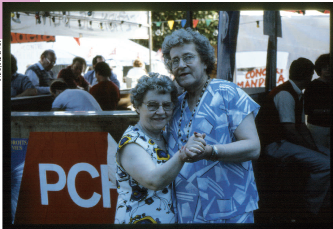
Appelez-moi Madame, de Françoise Romand : l'histoire d'un homme qui devient femme, et de sa femme qui le reste.

Pour le Mois du film documentaire, en novembre 2010, la médiathèque de Bagnolet a choisi de donner la parole à une réalisatrice bagnoletaise, Françoise Romand. L'occasion de découvrir un cinéma documentaire qui transforme sous nos yeux le réel en fiction délicieuse.